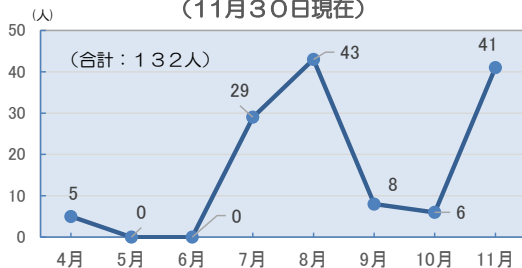
刈谷市 新型コロナ感染症患者発生件数推移 (11月30日現在)