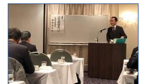
ジブリパーク整備事業

愛知のイノベーション創出拠点『ステーションA1』の整備、22年秋開業『ジブリパーク』『リニア開業見を据えた名古屋駅スーパーターミナル化』など、13本の柱を重点に予算編成。