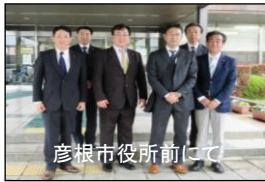
彦根市役所前にて