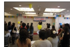
12月18日(日)14:00~ 刈谷プラザホテルにて